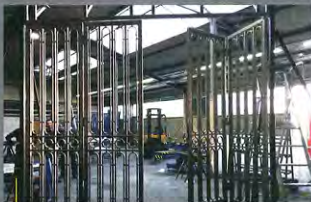
Lenoir Métallerie se développe vers la serrurerie fine, ici pour Hermès